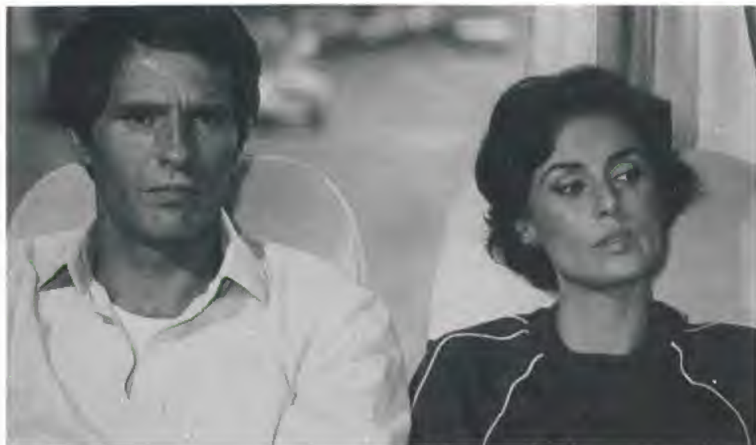
Giuliano Gemma – Helena Rojo